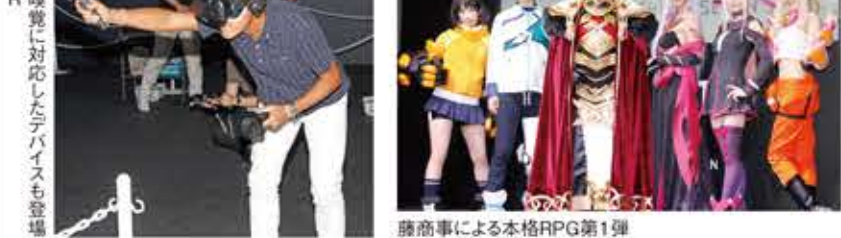
VR体験コーナーの様子

パチンコ祭り 2017年9月21日(金)～23日(日)の3日間、千葉県浦安市の「パチンコ祭り」が開催された。36の国と地域から609の企業・団体が参加し、約26万人が来場した。 2017年のテーマは「さあ現実を超えた体験へ」。昨年コーナーを新設した「VR体験」が、注目を集めた。VR体験コーナーでは、最新のVRヘッドセットを装着し、没入型のゲームを楽しむことができる。また、VR体験コーナーでは、最新のVRヘッドセットを装着し、没入型のゲームを楽しむことができる。