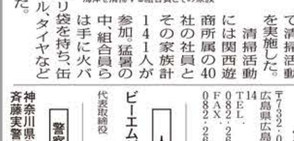
海岸を清掃する組合員とその家族

関西遊商 組合員らが海岸清掃 関西遊商の組合員らが、海岸清掃を行った。清掃活動は、9月22日(日)に行われ、約1時間かけて海岸の美化に努めた。