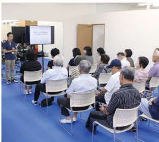
視察者に感謝と結果を報告した

「健康」へのラポは昨 年9月から今年8月ま で、広島県三原市でア ミューズメントと フィットネスを融合した 施設「LABORATOR IO」を広島県三原市 に開設する。LABOR TRIOは、同社と国立 広島大学、県立広島大 が共同研究してきた健 康づくりラボを発展さ せた新たな施設。