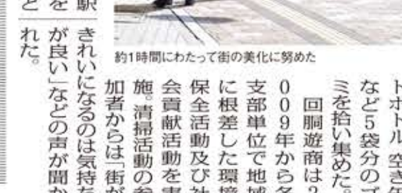
約1時間かけて街の美化に努めた

回廊遊商 広島駅周辺を清掃 回廊遊商が、広島駅周辺を清掃した。清掃活動は、9月8日(日)に行われ、約1時間かけて街の美化に努めた。