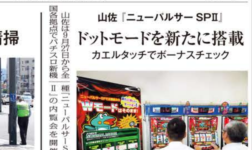
実績のあるバルサーシリーズに期待を寄せるホール関係者

山佐「ニューバルサー SPII」 ドットモードを新たに搭載 カエルタッチでボーナスチェック 山佐は9月27日(日)から全パチンコホールに「ニューバルサー SPII」を導入した。この機種は、ドットモードを新たに搭載し、カエルタッチでボーナスチェックが可能である。