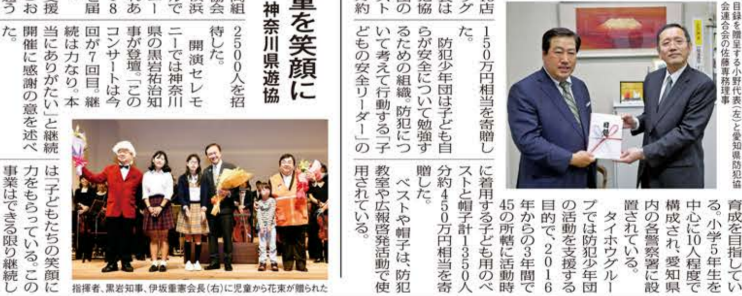
音楽で児童を笑顔に 神奈川県遊協