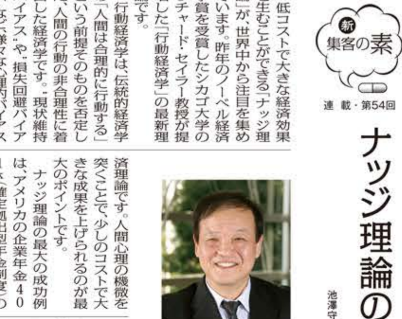
女性社員がグループ討議 日遊協人材育成委員会

日遊協人材育成委員会は、6月21日、東京都千代田区千代田の本会館で、女性社員を対象としたグループ討議を開催した。討議では、女性社員の活躍の場を広げるための取り組みや、職場環境の改善について、関係機関の代表者が挨拶を述べた。また、討議では、女性社員の活躍の場を広げるための取り組みや、職場環境の改善について、関係機関の代表者が挨拶を述べた。討議では、女性社員の活躍の場を広げるための取り組みや、職場環境の改善について、関係機関の代表者が挨拶を述べた。