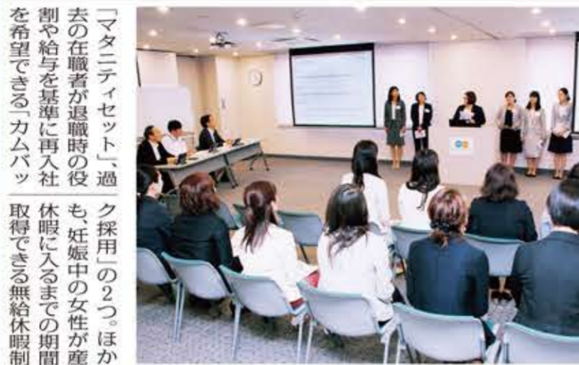
ダイナムは6月19日、都内本社ビルで女性活躍推進チームが主催する「女性活躍推進活動成果報告会」を開催した。

ダイナム 女性活躍推進活動 成果報告会を開催 ダイナムは6月19日、都内本社ビルで女性活躍推進チームが主催する「女性活躍推進活動成果報告会」を開催した。報告会には、ダイナム各事業部の女性活躍推進担当者、関係機関の代表者など約100名が参加した。報告会では、ダイナムの女性活躍推進活動の現状と今後の取り組みについて、ダイナム代表取締役社長が挨拶を述べた。また、ダイナムの女性活躍推進活動の成果について、ダイナム各事業部の女性活躍推進担当者が報告を行った。報告会では、ダイナムの女性活躍推進活動の現状と今後の取り組みについて、ダイナム代表取締役社長が挨拶を述べた。また、ダイナムの女性活躍推進活動の成果について、ダイナム各事業部の女性活躍推進担当者が報告を行った。