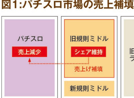
2019年新規則機移行のメイン 優先入替対象

「入替の経費は膨大で、新規則機への移行はスムーズに行うためには計画的段階的な入替戦略が欠かせない」と青山氏は言う。