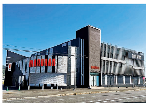
【新砂川店】(北海道砂川市、555台)

「M&Aで年間5店舗出店へ」の理由。ホール業界では今後スマート遊技機導入に向けた設備投資が本格化する。この一因をどう捉えるかが事業継続を決定する分かれ目といっている。そうし