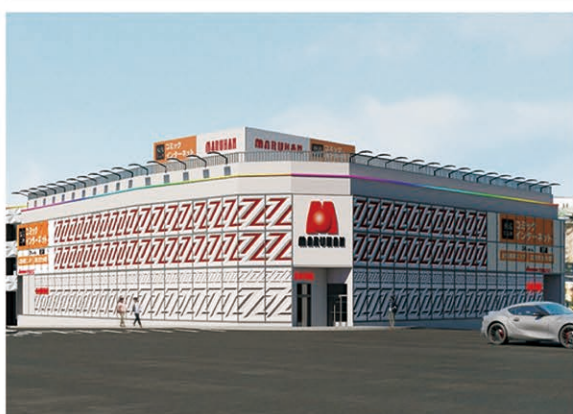
【茶屋が坂店】(愛知県名古屋市、446台)

「M&Aでは信用に値する買い手を確保することが重要になる。不慣れた売り手に対する気遣い配慮を行うことが出来る買い手の豊富な経験は、各種の段取りを円滑に進める推進力になる。他方で、売り手の最大の関心事は売却価格だ。北日本Cは評価額が分かるのれん代をどのように評価するかが。『有形財産の不動産は簿価、遊技機は中古相場相場格ブランドの無形財産は利益の3〜4年分を想定しています。ただしその額は、当社が運営した場合の算出額、他法人よりも良い条件を提示できます。』(三原部長)