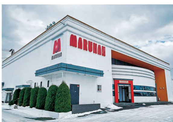
【広面店】(秋田県秋田市、420台)