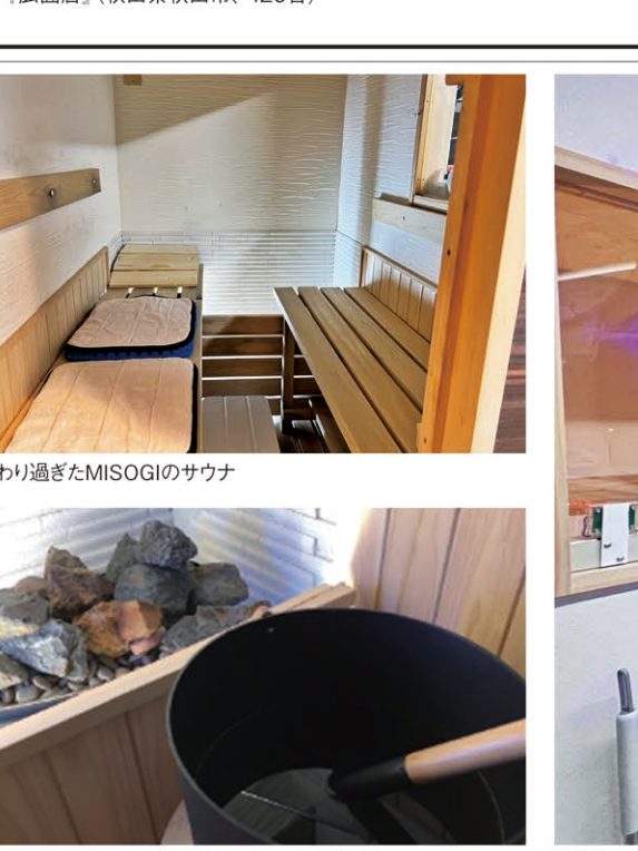
出店場所の決定から3カ月以内のオープンが可能

現状の経営法人では難しくても、業界最大手というマルハンブランドがあれば、活性化できる公算は高い。資本力、人材、企業風土、ノウハウ。これまで300店舗以上で実施してきたセグメント戦略は、商圏人口や競