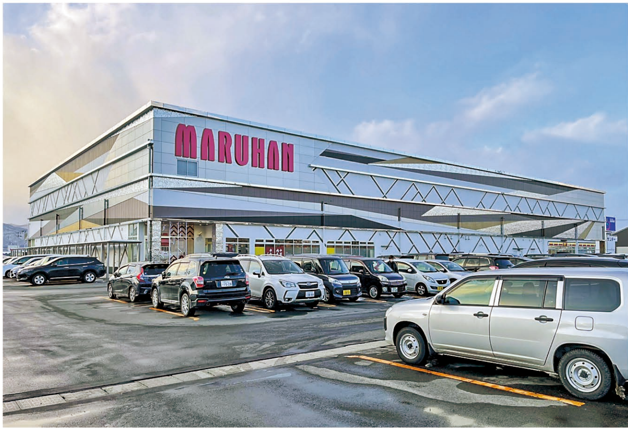
【盛岡みだけ店】(岩手県盛岡市、1261台)

マルハン北日本カンパニーが出店攻勢を強めている。2023年3月期(2023年4月1日から2023年3月31日まで)では第3Qまでに5店舗をランドオープン。そのすべてが新築でなく、居抜き物件だった。出店した地域を掌管するマルハン北日本カンパニーの目論見を