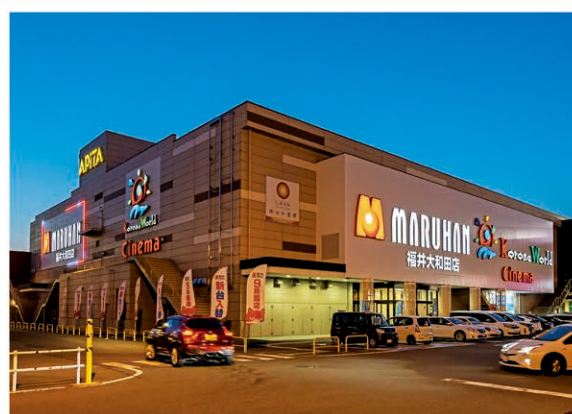
【福井大和田店】(福井県福井市、617台)