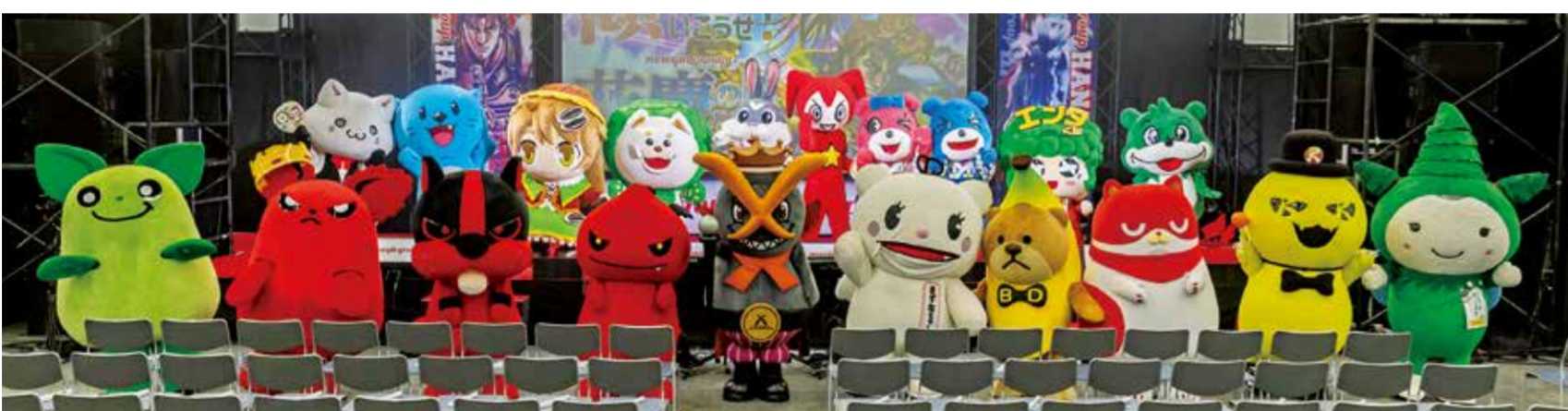
後列左から、イチゴくん(第一プラザ)、ニラッコ(ニラク)、ひなたひな(ひまわり)、エルガー(ライブガーデン)、ラヴィくん(VZONE)、マックス君(ベルエアマックス)、にゅ&とんくん(ニュー太平)、エンタくん(123)、ピクマくん(ピクママーチ) 前列左から、クリン&ゴプリン(ラカータ)、ナナ丸(つかさ)、スナキー(Dステーション)、エクス大王(エクス・アリーナ)、きずなちゃん(Dステーション)、BIGくん(BIGディッパー)、にゃんまる(マルハン)、バトラーくん(キコーナ)、モリス君(ダイナム)