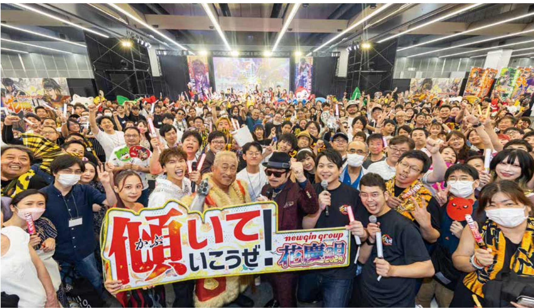
©隆慶一郎・原哲夫・麻生未央 / コアミックス 1990 原権許証証 S05-02H