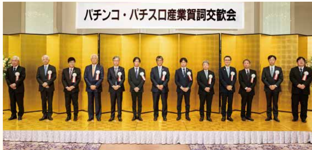
2024年のパチンコ・パチスロ産業賀詞交歓会