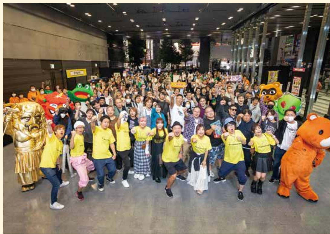
2024年11月に開催された「パチスロサミット2024」