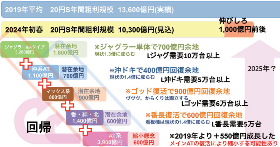
図1 パチスロは2026年までは足し算で考える