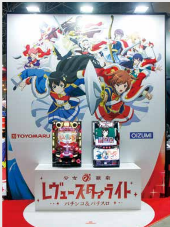
大型パネルと実機を展示したこの場所は撮影スポットとなっていた

まだ根強い歌劇レヴューというコンテンツ、パチンコとパチスロとパチンコとパチスロの両方を楽しみたいというファンが、ここでも多 く見られた。物販ブースではパチンコとパチスロのオリジナルグッズ全9種類を販売。主要キャラクター9人分を用意したアクリルスタンドやキーホルダーに加えて、壁に飾れるタペストリーやポスターなども用意した。缶バッジはデザインの異なるAとBの2種類。それぞれ9人のキャラクター1分用意されており、プライド販売となっていたため、コンプリート可能なBOX買いをする来場者もいた。