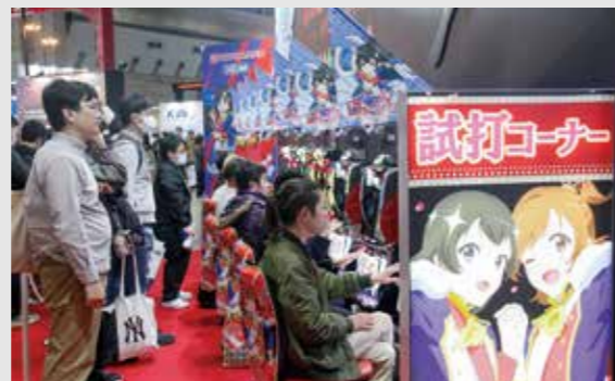
オーイズミと豊丸産業の合同ブース