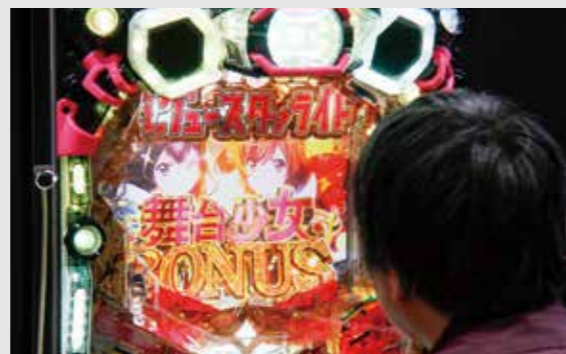
【P少女☆歌劇 レヴュースタァライト ラッキートリガー-4500】