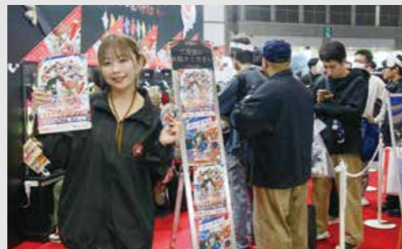
遊技した来場者にはオリジナルステッカーをプレゼント