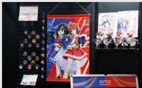
全9種類のグッズを展開