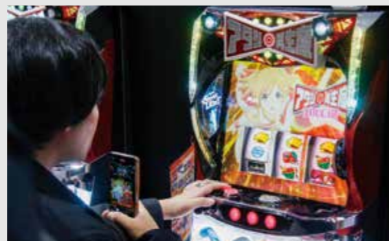
【L少女☆歌劇 レヴュースタァライト -The SLOT-】