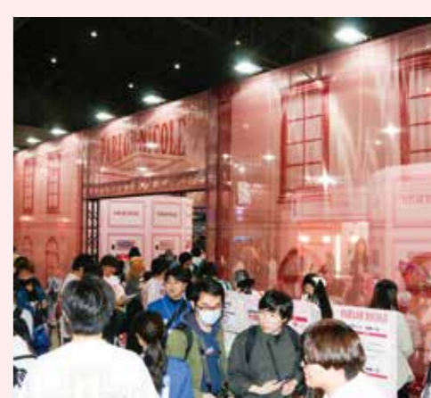
かわいいピンクが目を引くブース

ピンクを基調にした海外のデザイナーズホテルを思わせるポップ&クラシカルな世界観のブースには、人気機種からホール未導入の最新機種までが楽しめる試打コーナーや、銀玉をモチーフとした万華鏡のような光あふれるフォトブース、「PACHI-PACHI-7」の一員であるビッグクラッピー、限定賞品が当たる巨大なガチャなどを用意。会場の中央に展開していた「パラニコル」は、ブ