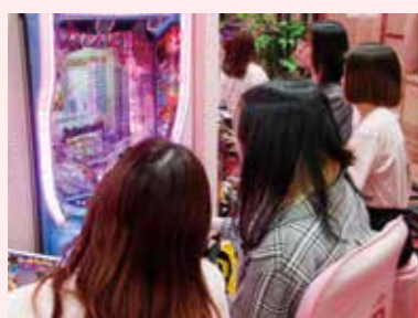
試打コーナーには女性来場者の姿も多かった

誰でも立ち寄れるフォトブースは、女性来場者やコスプレイヤーたちが列を作るほどの人気ぶり。ビッグクラッピーと記念撮影する来場者の姿も多かった。試打体験、またはブースで撮影した写