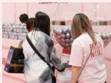
ガチャは試打やSNS投稿で引くことができた

真にハッシュタグを付けてSNSに投稿すると、藤田ニコルさんがプロデュースした折りたたみ傘やトートバッグ、ヘアピンなど「推しの日」限定賞品が当たるガチャ抽選会に参加可能。こちらは誰でも気軽に参加できることから、パチンコ・パチスロに関心がない人たちも数多くが参加していた。 会期の2日間で試打を体験したのは918人、そのうちの約41%にあたる376人が未経験者だった。SNS投稿数は1580、ガチャ抽選会に参加した人数は2860人を突破。BUNPACHIIP、想定以上の来場者がある「パラニコル」は開催された「推しの日」として絶好の場になった。業界初の試みとプレテストは終了し、ユーザー獲得の起爆剤となる施策になるのか注